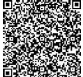
QR Code แบบสอบถาม

๓. นับผลการสำรวจแบบสอบถามได้ถึงวันที่เข้าตรวจ