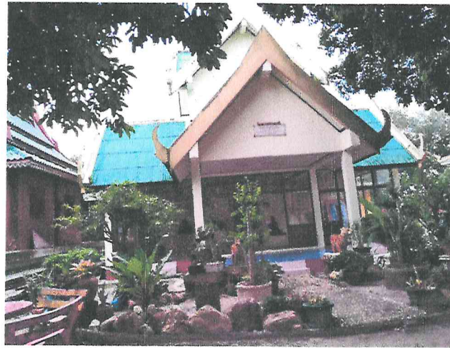
ที่ประดิษฐานรูปปั้นอดีตเจ้าอาวาสวัดทุ่งต้อ ซึ่งเป็น ที่เคารพสักการบูชาของชาวบ้านตำบลทุ่งต้อ (หลังเดิม)