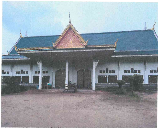
ศาลาการเปรียญ