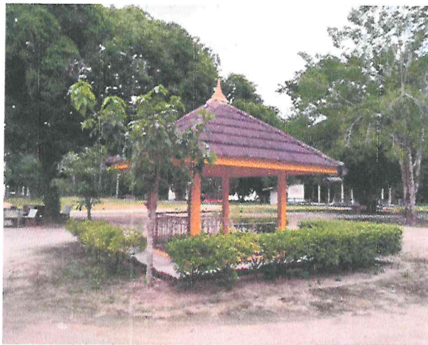
ศาลหลักวัดทุ่งต้อ