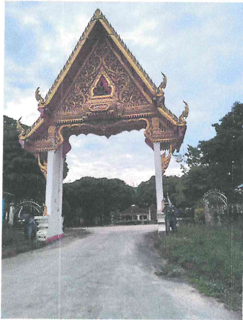
ซุ้มประตูทางเข้า