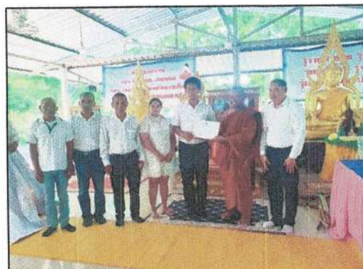
โครงการฝึกอบรมคุณธรรม จริยธรรมการปฏิบัติงานของบุคลากร อบต.ทุ่งต่อ