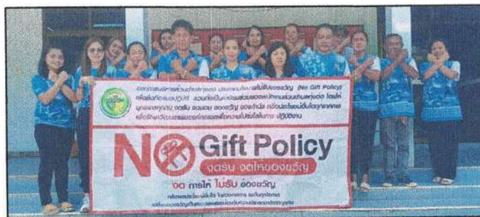
ประกาศนโยบายไม่รับของขวัญและของกำนัลทุกชนิดจากการปฏิบัติหน้าที่ (No Gift Policy)