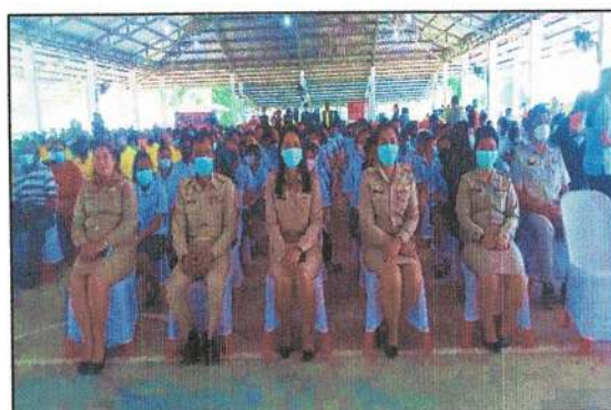
โครงการองค์การบริหารส่วนตำบลพบประชาชน