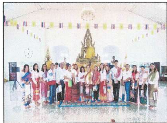
กิจกรรม หัวชั้น พาดผ้า พาปิ่นโต เฮโลไปวัด ณ วัดทุ่งต่อ