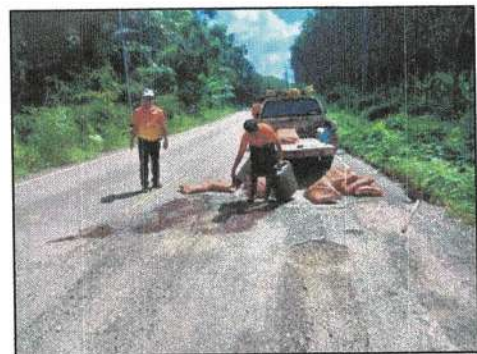
ซ่อมแซมถนนสายหลัก - สายรอง ขององค์การบริหารส่วนตำบลทุ่งต่อ