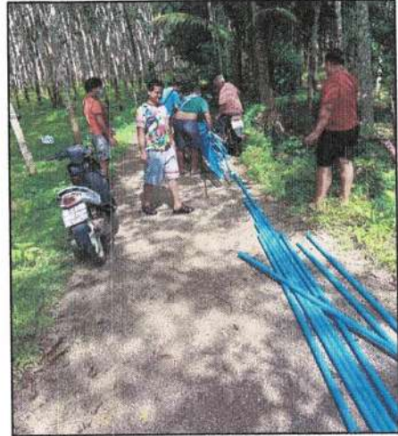
ปรับปรุงและซ่อมแซมระบบประปาในพื้นที่องค์การบริหารส่วนตำบลทุ่งต่อ