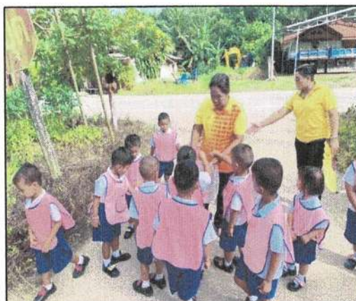
จัดกิจกรรมจิตอาสาพัฒนาสิ่งแวดล้อมเก็บขยะ สองข้างถนน ทางเข้าศูนย์พัฒนาเด็กเล็กตำบลทุ่งต่อ