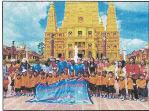
โครงการสนับสนุนค่าใช้จ่ายการบริหารสถานศึกษา ค่ากิจกรรมพัฒนาผู้เรียน (ทัศนศึกษา) ของศูนย์พัฒนาเด็กเล็กตำบลทุ่งต่อ ณ จังหวัดกระบี่