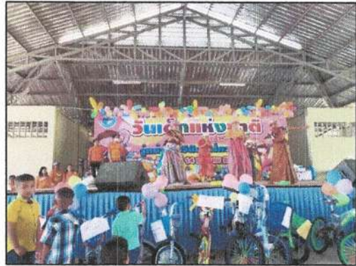
โครงการวันเด็กแห่งชาติ ประจำปี ๒๕๖๖