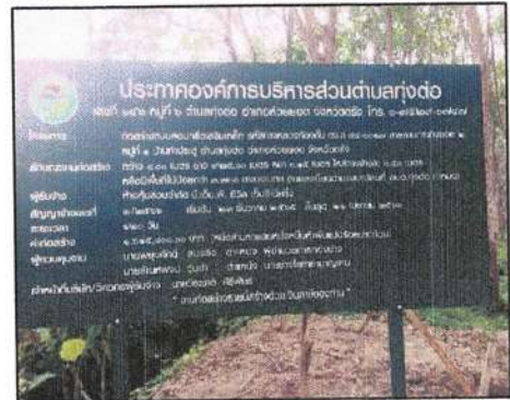
โครงการก่อสร้างถนนคอนกรีตเสริมเหล็ก รหัสทางหลวงท้องถิ่น ตง.ถ.๔๔-๐๐๑๗ สายลานกระทิงซอย ๒ หมู่ที่ ๑ ตำบลทุ่งต่อ อำเภอย้ายยอด จังหวัดตรัง