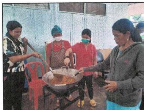
โครงการฝึกอบรมอาชีพให้แก่ประชาชนหมู่ที่ ๑ - ๘ ตำบลทุ่งต่อ ณ องค์การบริหารส่วนตำบลทุ่งต่อ กิจกรรมการทำน้ำพริกกากหมู น้ำพริกตาแดง น้ำพริกปลาฉิ่งฉ้าง