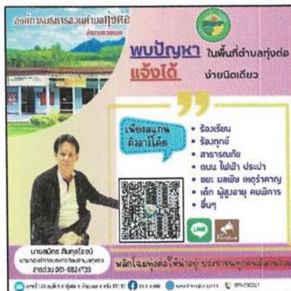
ช่องทางในการรับแจ้งปัญหาเมืองยุค ๔.๐ แจ้งปัญหาที่พบได้ ผ่าน Line @Traffy Fondue มายัง อบต.ทุ่งต่อ ได้ตลอด ๒๔ ชั่วโมง