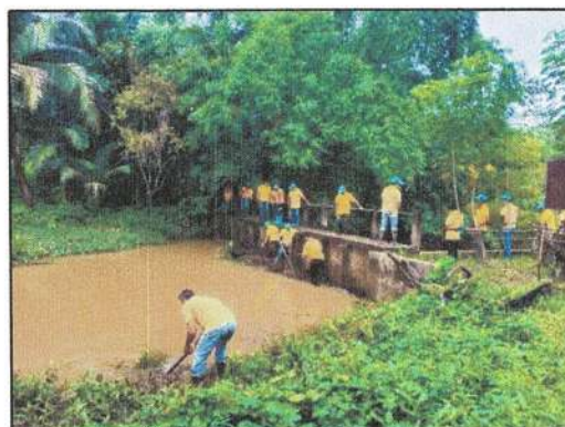
โครงการกำจัดผักตบชวาและวัชพืชในแหล่งน้ำ