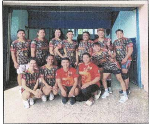
จัดส่งตัวแทนนักกีฬาเข้าร่วมแข่งขันกีฬา