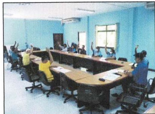
การประชุมคณะกรรมการพัฒนาองค์การบริหารส่วนตำบลทุ่งต่อ เพื่อร่วมพิจารณาร่างแผนพัฒนาท้องถิ่น (พ.ศ.๒๕๖๖-๒๕๗๐) เพิ่มเติม ฉบับที่ ๑