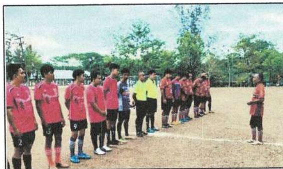
โครงการจัดการแข่งขันกีฬาต้านยาเสพติด ประจำปี ๒๕๖๖