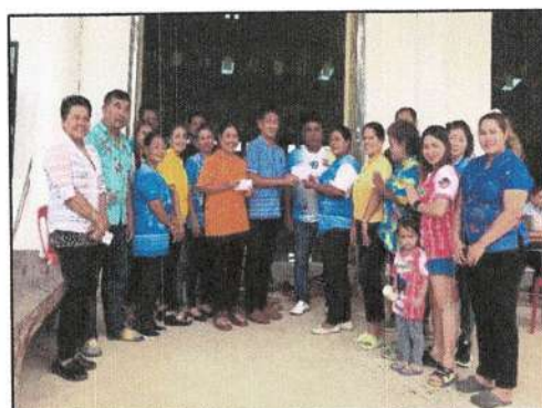
ส่งเสริมกลุ่มบาสโลบตำบลทุ่งต่อ