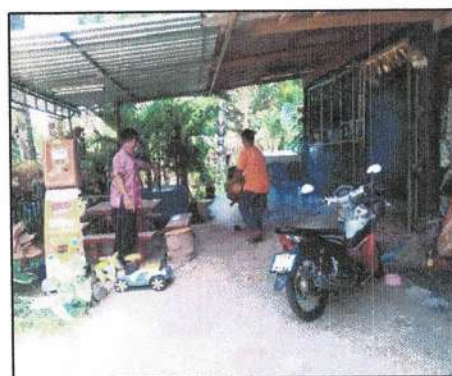
โครงการรณรงค์ป้องกันโรคไข้เลือดออก