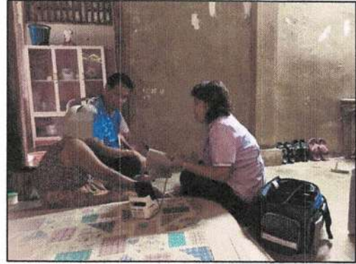
ลงพื้นที่เยี่ยมบ้านผู้สูงอายุ