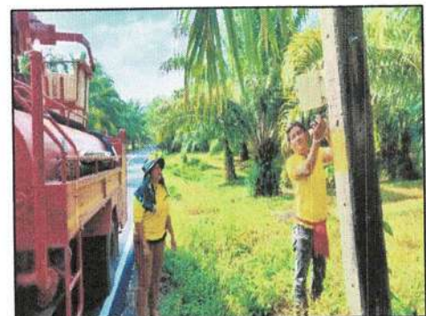
ติดตั้งและปรับปรุงไฟฟ้าส่องสว่างตามถนนในพื้นที่องค์การบริหารส่วนตำบลทุ่งต่อ