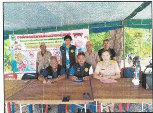
โครงการป้องกันและลดอุบัติเหตุทางถนนช่วงเทศกาลปีใหม่และช่วงเทศกาลวันสงกรานต์