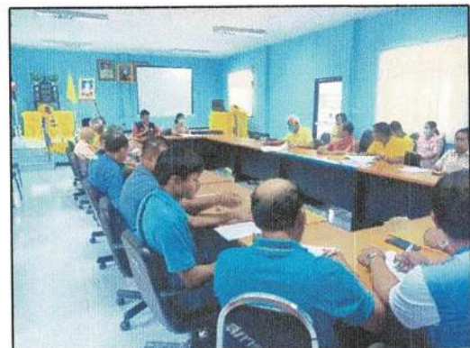
การประชุมประชาคมตำบล