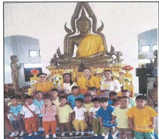
กิจกรรมแห่เทียนพรรษาของศูนย์พัฒนาเด็กเล็กตำบลทุ่งต่อ และโรงเรียนบ้านทุ่งต่อ ณ วัดทุ่งต่อ