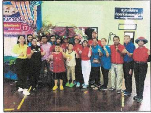
อุดหนุนชมรมผู้สูงอายุเพื่อเป็นค่าใช้จ่ายโครงการส่งนักกีฬาเข้าร่วมการแข่งขันกีฬาผู้สูงอายุ