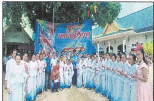
โครงการกิจกรรมวันผู้สูงอายุ ประจำปี ๒๕๖๖