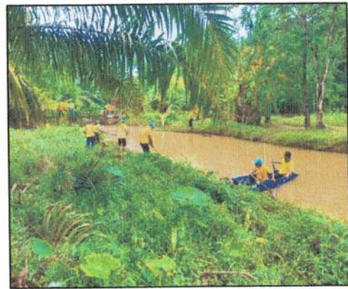
ขุดลอกคลอง เพื่อป้องกันปัญหาน้ำท่วมในพื้นที่องค์การบริหารส่วนตำบลทุ่งต่อ