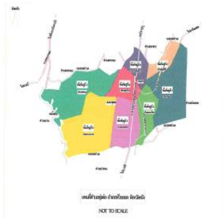
แผนที่ 1 : แสดงที่ตั้งและอาณาเขต

อาณาเขตและเขตติดต่อ องค์การบริหารส่วนตำบลทุ่งต่อ มีพื้นที่ 30.97 ตารางกิโลเมตร มีอาณาเขตติดต่อดังนี้