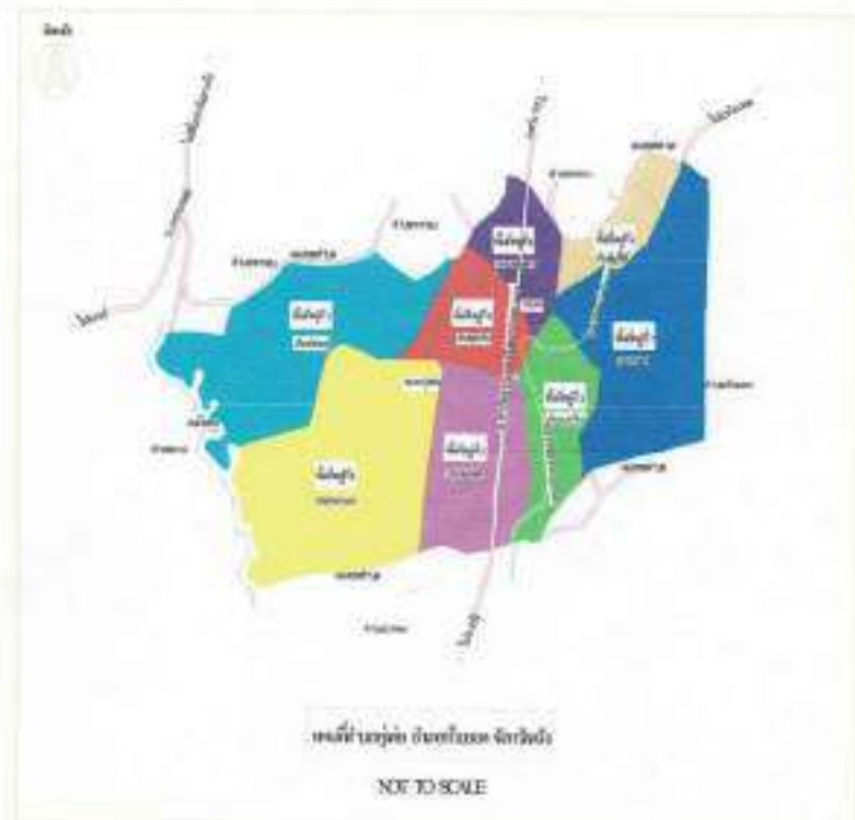
แผนที่ ๓ : แสดงที่ตั้งและอาณาเขต

อาณาเขตและเขตติดต่อ องค์การบริหารส่วนตำบลทุ่งต่อ มีพื้นที่ ๓๐.๘๗ ตารางกิโลเมตร มีอาณาเขตติดต่อดังนี้